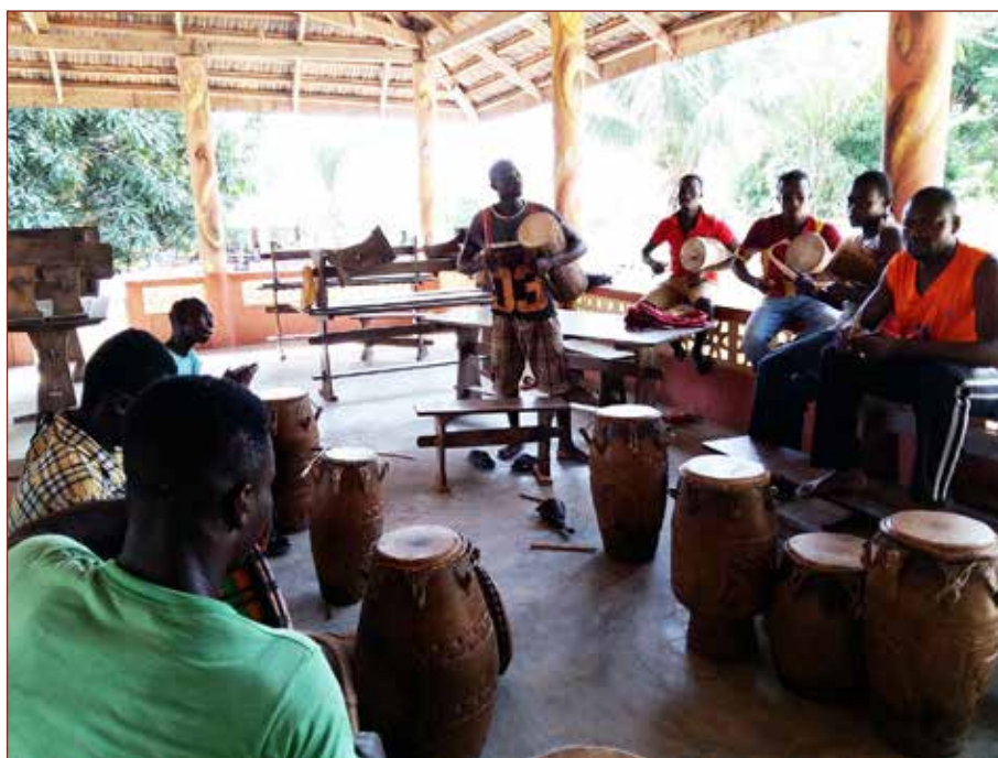
Trommelworkshop mit den Fortgeschrittenen

Ich möchte eine Bewerbung bei der KinderKulturKarawane für eine Tournee im Jahr 2019 schreiben.