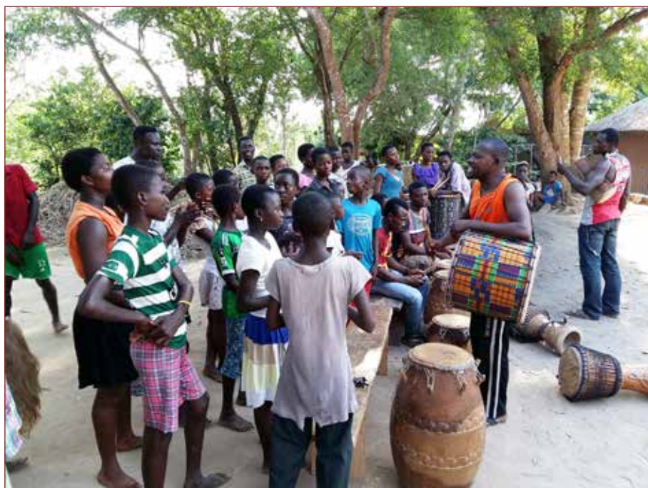
Tanzworkshop in Northener Tänzen