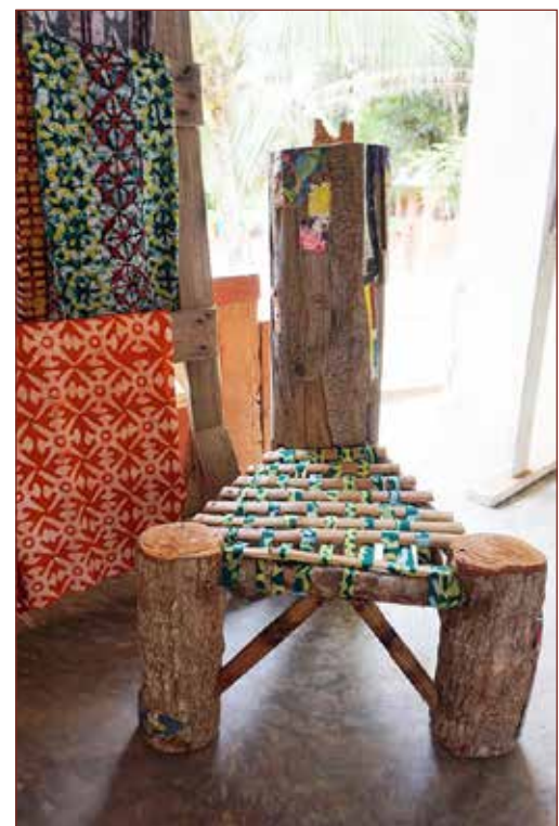
Aus dem Kunstunterricht