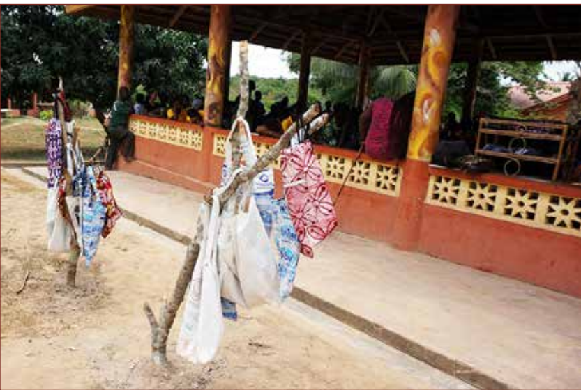
Ausstellung am letzten Schultag