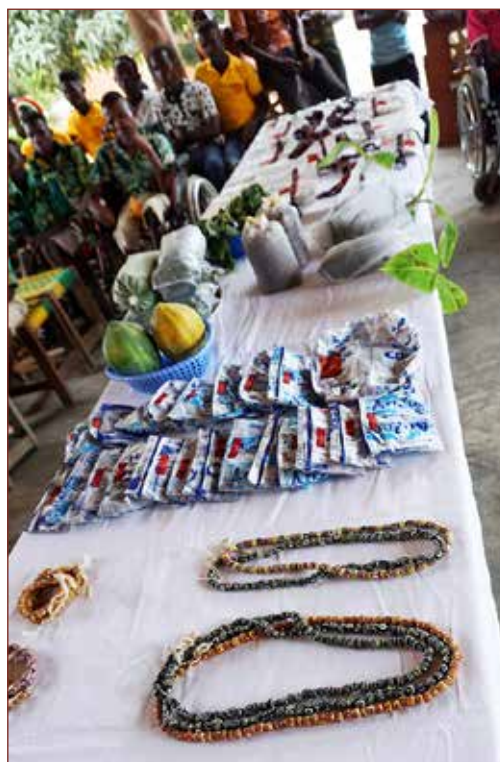
Beads und anderes