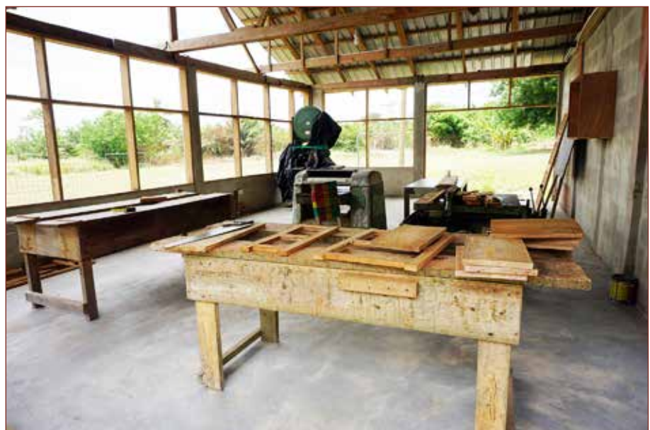
Hier wird in Kuerze mit den großen Maschinen gearbeitet.